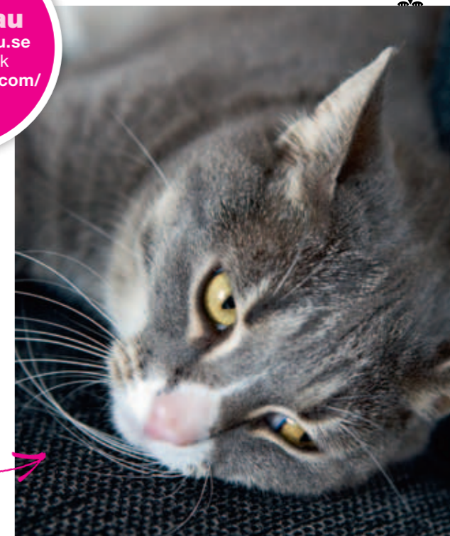
Festis är en av Sandras två hittekatter.