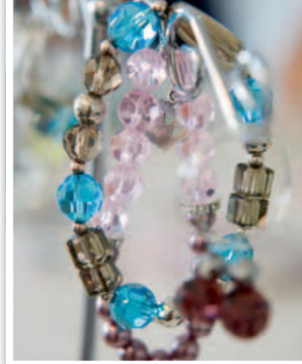
De ”karamelliga” armbanden är två av alla de smycken som säljs till förmån för katter som har det svårt.