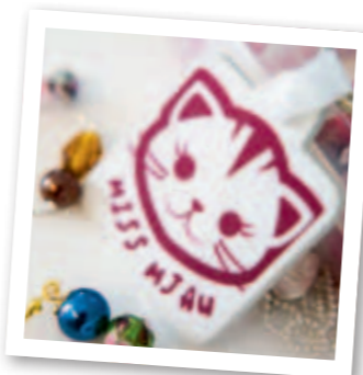
Miss Mjaus logga är ett litet sött, rosa kattansikte.